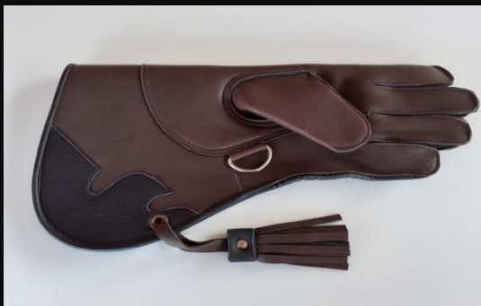
Guante niñ@ Piel de vaca 002: 20 €