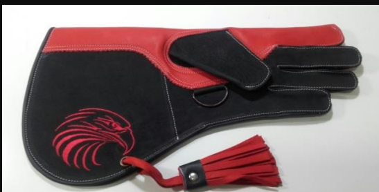
Guante Largo cuero Ref.001 2 capas: 25 €