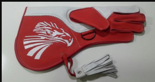
Guante Largo cuero Ref.003 2 capas: 25 €