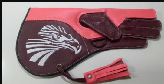
Guante Largo cuero Ref.002 2 capas: 25 €