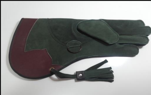
Guante Largo Nobuk verde 2 capas: 25 €