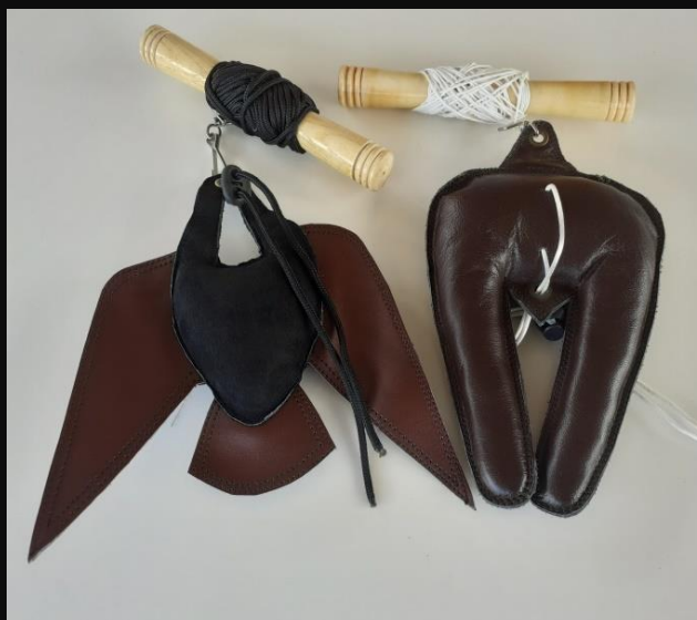
Señuelo CONEJO: 20 €