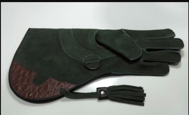
Guante 3 capas Águila//Búho: 38