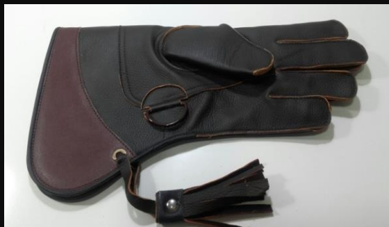
Guante Corto Halcón Ref.004 2 capas: 25 €