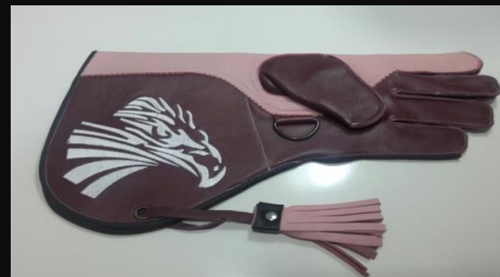
Guante Largo cuero Ref.005 2 capas: 25 €