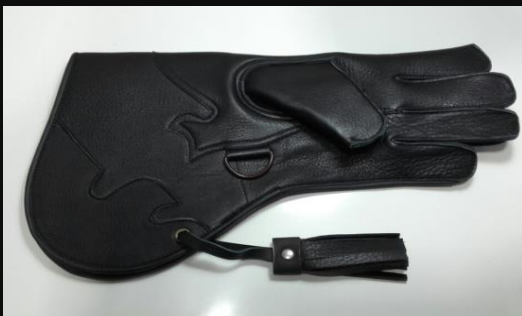
Guante Largo cuero negro 2 capas: 25 €