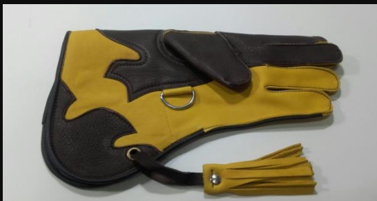
Guante niña@ Piel de vaca 003: 20 €