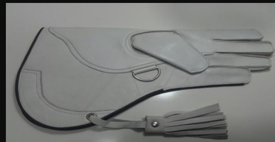
Guante Largo cuero Ref.006 2 capas: 25 €