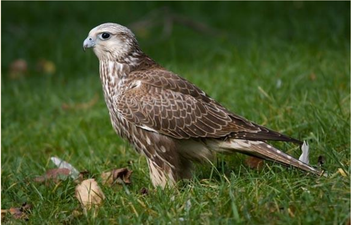
20 Sacre ( Falco cherrug )