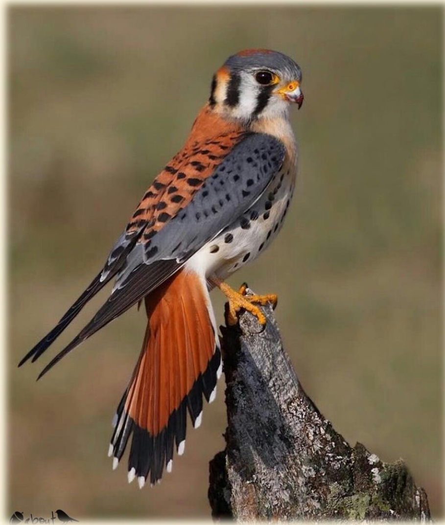
26 Macho luciendo su bonita coloración

Es bastante económico y fácil de transportar por lo que es el compañero ideal del cetrero que no tiene el tiempo o las condiciones de mantener otro tipo de rapaces de mayor porte.