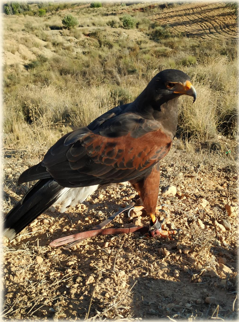
36) Atila, mi torzuelo de Águila de Harris