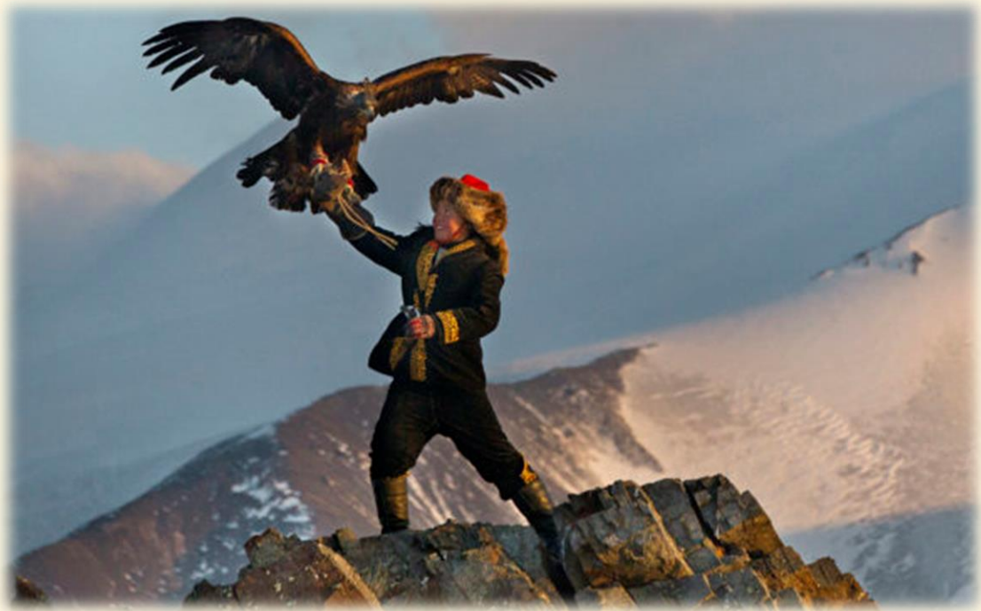
27) Mongol portando su águila