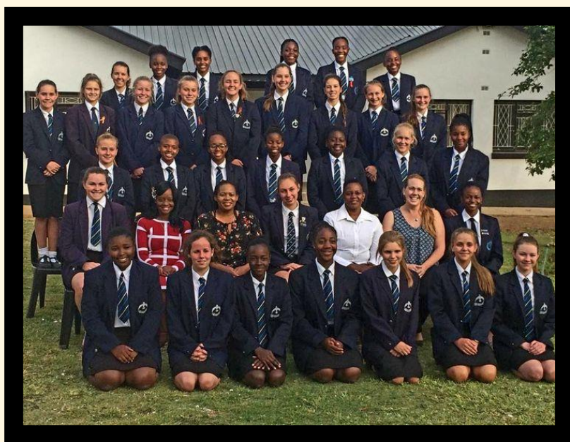
29) Alumnos del Falcon College

Como ejercicio de clase deben capturar un espécimen en campo, controlar su evolución, adiestrarla y cazar con ella (ojalá se realizara esto en España). A final de la temporada se devuelve a su hábitat o se alarga un año más para que un cetrero joven aprenda. Este mismo grupo de cetreros de Zimbabwe se encargan de la conservación de las rapaces en el país y tienen numerosas publicaciones de prestigio internacional. También tienen programas de reproducción de aves en peligro y han conseguido reproducir el halcón Taita ( Falco fasciatus ), un hito mundial. El daño que es posible generar en el medio con la captura de ejemplares para la cetrería se convierte en educación ambiental, respeto y cariño hacia estos animales. No olvidemos que todo lo que no se explota, no se emplea y se mantiene en el olvido acaba deteriorándose por norma. La clave está en visualizar, en este caso, la cetrería y las rapaces.