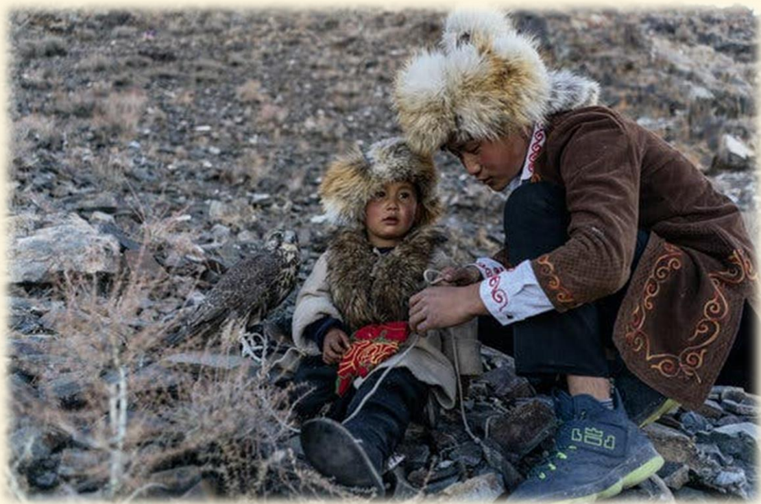
28) Mongoles con su halcón