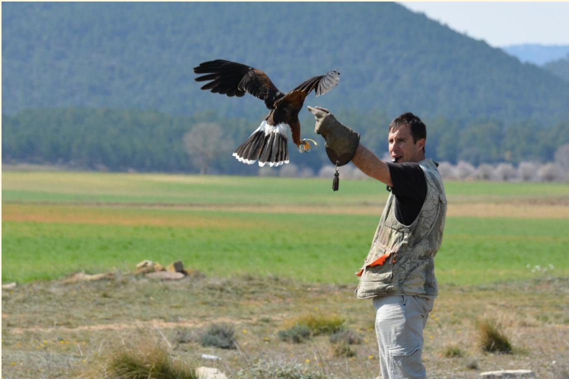
10) Harris acudiendo al puño.

pito porque su pérdida o sustitución puede ser un problema. En mi caso, yo le llamo por su nombre, pero por lo general la gente suele usar un silbido o un grito.