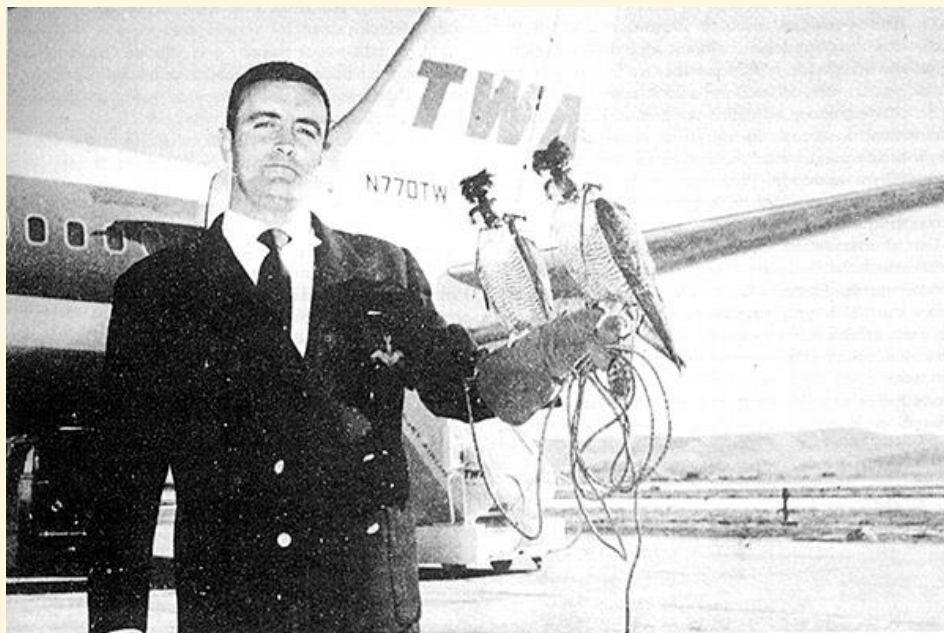
1 Félix Rodríguez de la Fuente en su expedición a Arabia Saudí

En 1954, nuestro admirado Félix Rodríguez de la Fuente recupera el arte de la cetrería en España y crea el Centro de Cetrería de Burgos, encuadrado en el Servicio Nacional de Pesca Fluvial y Caza. Fue en 1962 cuando formando parte de una representación diplomática española, Félix Rodríguez de la Fuente llevó al rey de Arabia Saudí, Saud Ibn Abdul-Aziz un regalo muy especial del Caudillo, una pareja de halcones peregrinos españoles. El rey saudí, gran aficionado a la cetrería, seguramente el último rey cetrero, soñaba con poseer un halcón baharí (la subespecie mediterránea del halcón peregrino que habita la Península Ibérica), el único regalo oficial capaz de despertar la atención de una persona que tenía de todo.