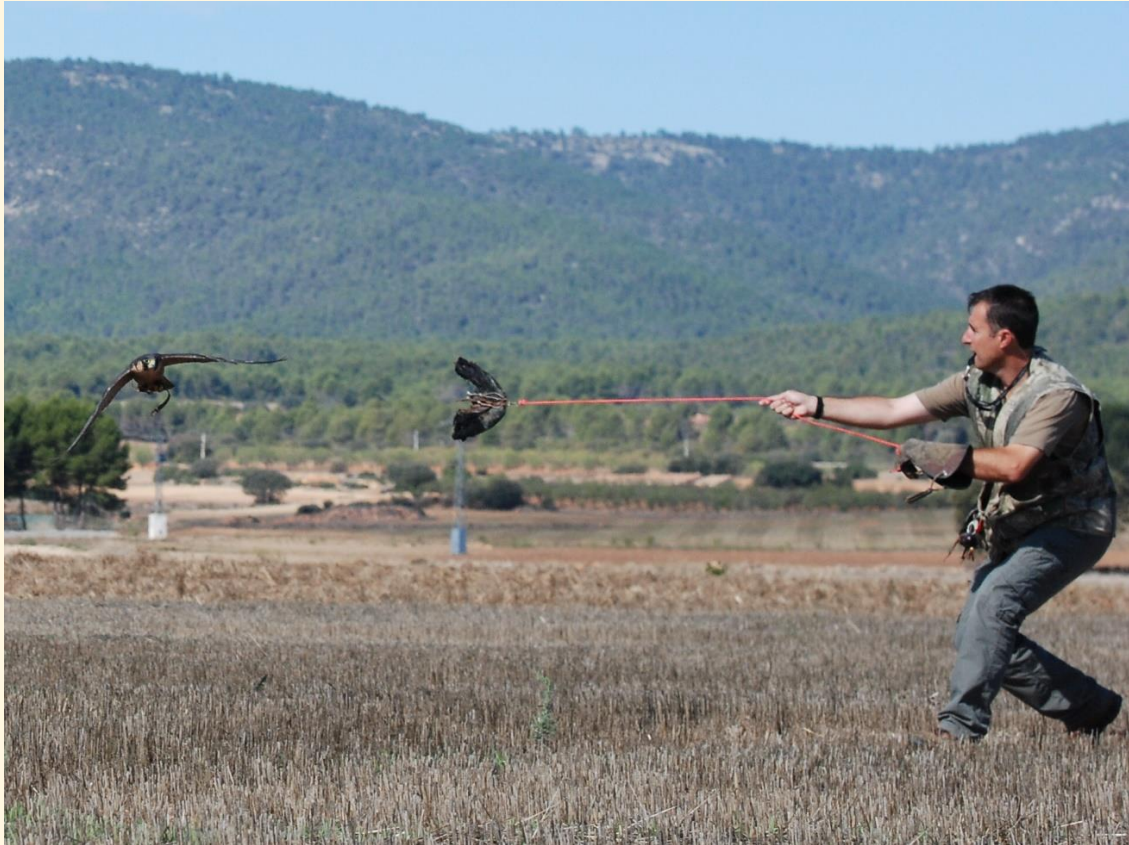
5) Halcón acudiendo al señuelo.