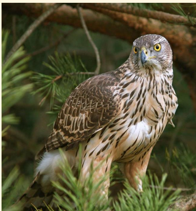
13) plumaje juvenil.

En cuanto a la cetrería es una de las aves más comunes, y una de las que más éxito tiene entre los cetreros más experimentados. La dificultad de su manejo es mayúscula, al tratarse de un ave muy arisca y feroz. Además, tiende a ser recelosa con la gente, la ropa llamativa y otras interferencias.