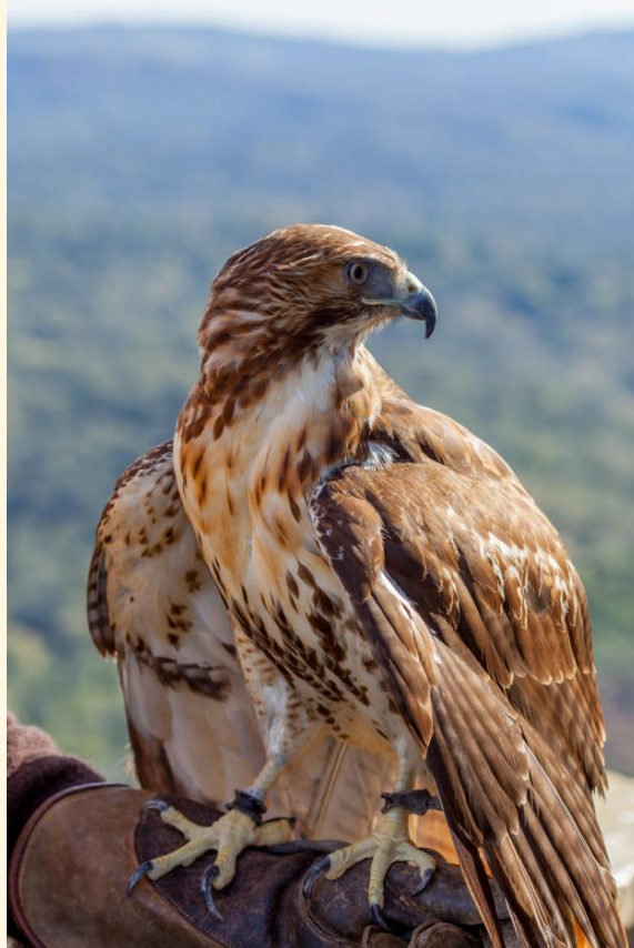
18) Águila cola roja posada en el puño

El precio en España suele rondar 700-100 euros