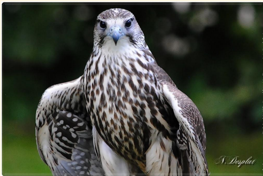
25 Gerifalte X Sacre

Los halcones son muy valorados, alcanzando precios de 4000-5000 euros de forma común en las especies más valoradas (principalmente gerifaltes), aunque por lo general rondan entre los 300 y los 2000.