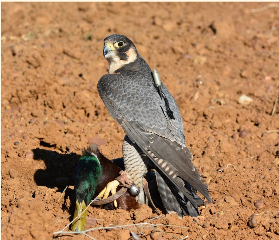
19 PEREGRINO ( Falco peregrinus ) De mi amigo Andrés López.

A continuación, podemos ver las principales especies e híbridos