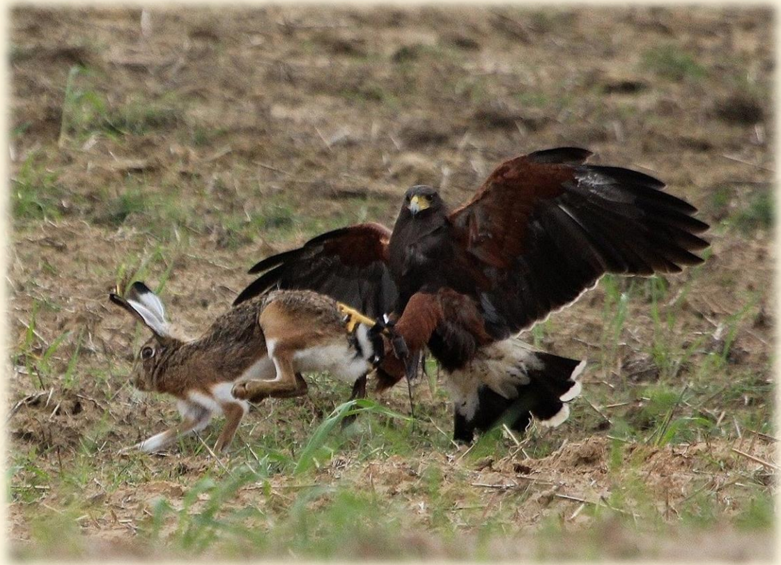
17) Hembra de harris dando caza a una liebre

Su coste suele rondar los 400 euros para machos y 700 para las hembras.