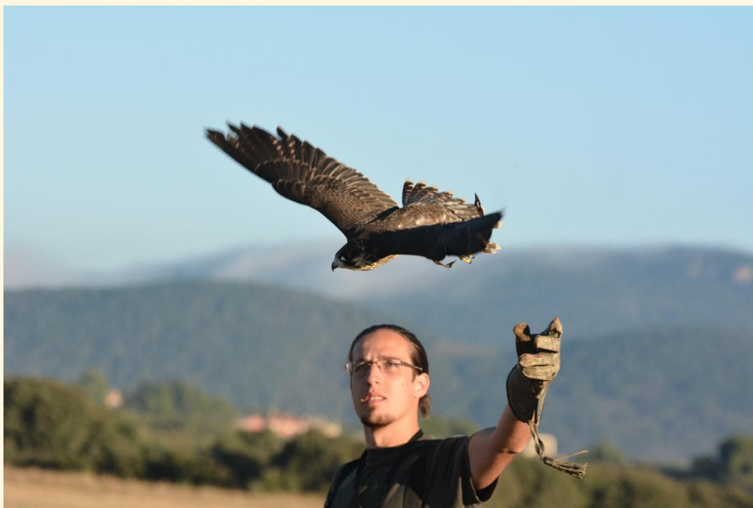
3) Soltando pihuelas.

Por lo general, la forma de trabajar en la caza por altanería es liberar a la rapaz de su caperuza y soltar pihuelas (correas de piel, tradicionalmente de perro, con las que se mantiene agarrado al ave de las patas) en cuanto llegamos a la zona de caza. Una vez allí los perros olfatean en busca de posibles presas, quedando de muestra esperando la indicación del cetrero.