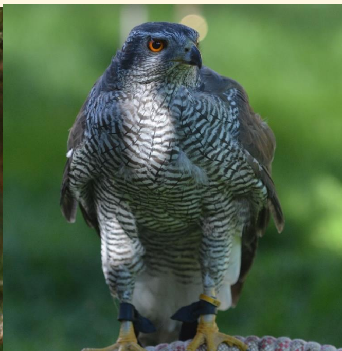
14) plumaje adulto.

Al realizar la primera muda, cambian el plumaje pardo por colores blancos y negros característicos y se tornan los ojos de amarillos y naranjas y a rojos intensos en las mudas sucesivas.