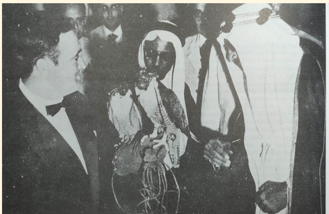
32) Imagen extraída directamente de "El Arte de la Cetrería" de Félix Rodríguez de la Fuente

En 1962 fue de embajador a Arabia Saudí como ya contamos anteriormente.