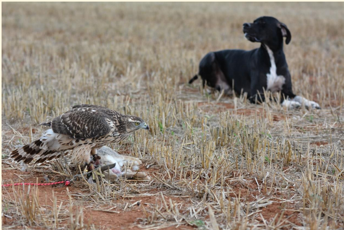
12) Azor joven alimentándose en un conejo.

La segunda etapa consiste en hacerle 2 o 3 sueltas de la pieza viva, a poder ser con dificultad progresiva y en un terreno ideal. La primera puede ser un conejo atado a un fiador, la segunda un gazapo y la tercera un conejo tipo en un lugar ideal. Si el animal da caza, podemos cambiar por su alimento diario la pieza capturada, o si no nos importa que estropee la pieza podemos abrísela allí mismo con la navaja y dejar que se alimente al gusto.