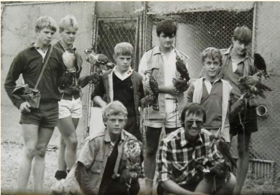
31) promoción de 1985 del Falcon College

Sin duda, África debiera ser otro paraíso para la práctica de la cetrería a nivel mundial, por los terrenos que atesora el continente, y la gran densidad y diversidad de presas a las que dar caza.