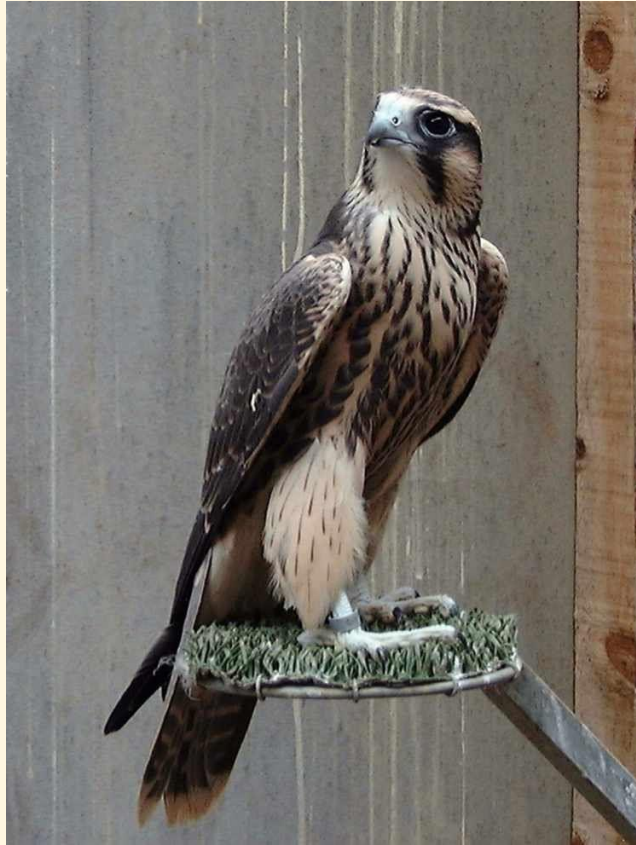
22 Lanario ( Falco biarmicus )