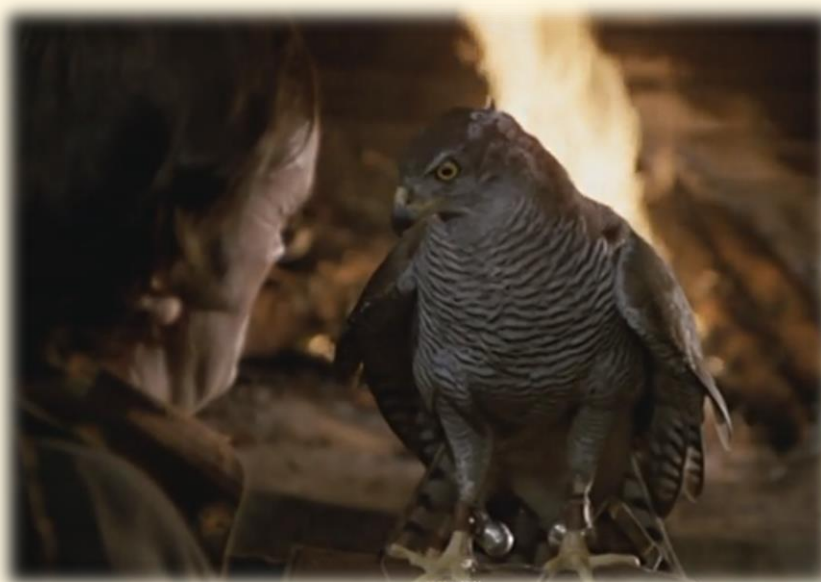
8 Taiga, el azor

“...Y naturalmente, la caperuza, esa cofia de cuero que a ustedes les ha sorprendido y que a nosotros nos permitirá manejar el azor durante dos largos días y dos noches de insomnio y de absoluta dieta.... Porque así, el hambre vencerá al temor que el pájaro pueda tenernos, el día que, por primera vez, junto a la chimenea, le quitemos la caperuza. La emoción de un halconero cuando quita por primera vez la caperuza a su pájaro recién capturado es indescriptible. ¿Cuál será la reacción del ave ante el rostro de su captor? ¿Cuál será la reacción de un ave salvaje, ante la presencia de aquél a quien debe considerar como su peor enemigo?... El hambre lo hace todo...hasta el punto de que podíamos ya tocarle las garras de acero, a pocos milímetros del pico, sin que jamás me rozara. Taiga, después de dos noches de insomnio y dos días de ayuno, empezaba a entrar en el hermoso juego de la doma.” (Taiga, el azor. El hombre y la Tierra. Félix Rodríguez de la Fuente)