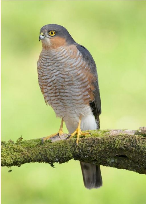
16) Torzuelo de gavián

Las piezas que pueden cazar los machos (también denominados en cetrería a los machos de todas las especies torzuelos) se limitan a pajarillos de cualquier clase y tipo, mientras que las hembras se emplean para cazar codornices, zorzales y esporádicamente alguna perdiz.