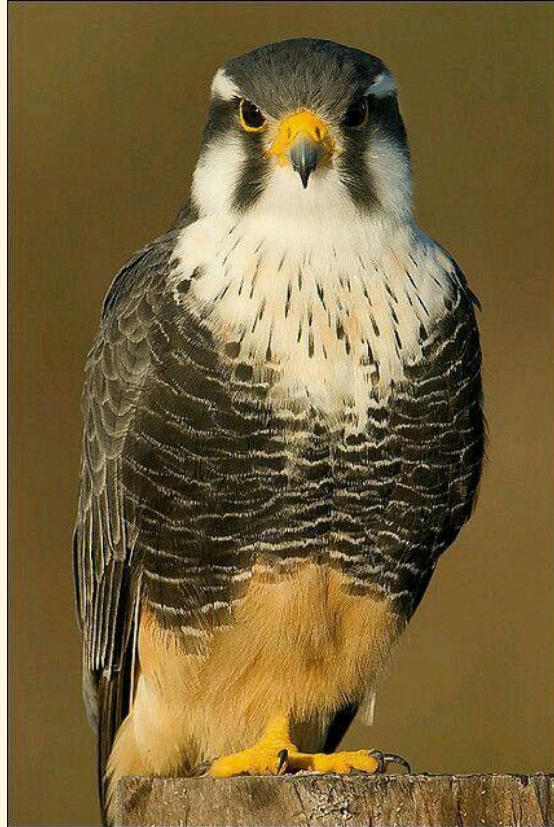
23 Aplomado ( Falco femoralis )