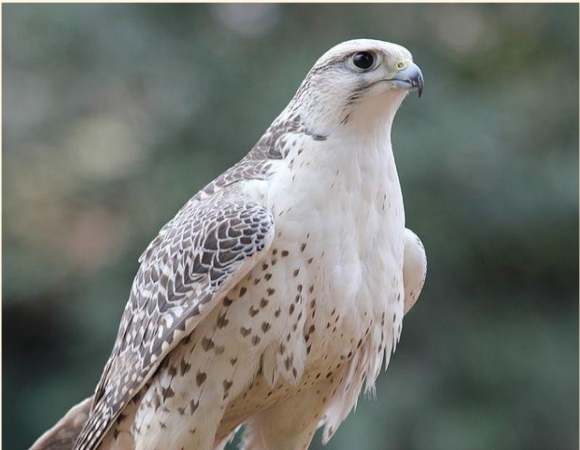
21 Gerifalte ( Falco rusticolus )