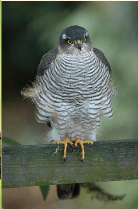
15 Hembra de gavián

Dado su tamaño no tienen gran calado entre los cetreros.