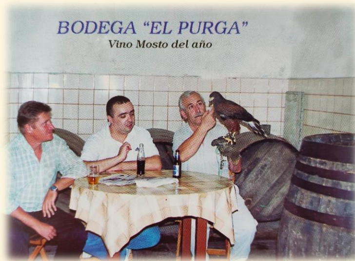
7) Imagen extraída del libro “La Leyenda del Águila de Harris”

Como habitualmente se dice, “la música amansa a las fieras”. En la cetrería se emplea la música y otras fórmulas para no dejar dormir a las aves de cetrería durante esta etapa. Hemos de desvelar al animal para vencer su voluntad. Habitualmente las bodegas y tabernas han sido lugares muy adecuados para placear por el sonido constante y entrenamiento y buen ambiente para el cetrero.