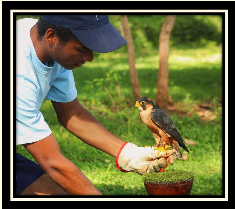
30) El último halcon Taita