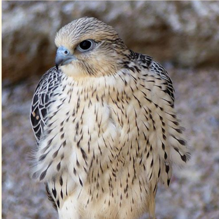
24) Gerifalte X Peregrino